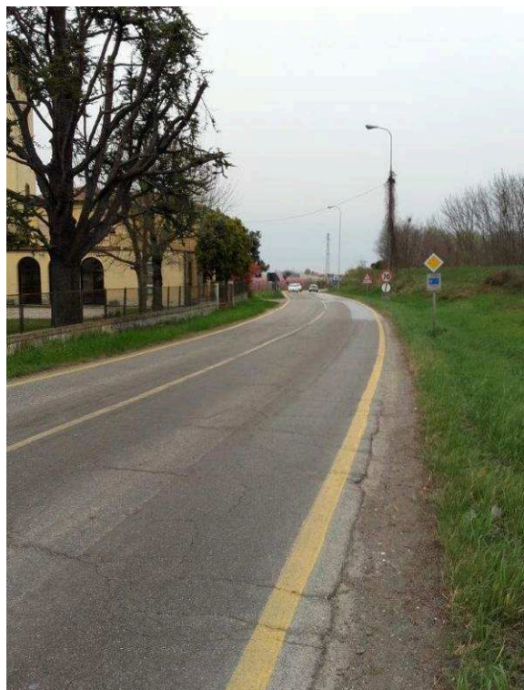
S.P. 7 SAN SILVESTRO FELISIO da PK 7+543 a PK 7+850